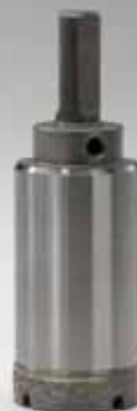
FORETTI PER TRAPANI MANUALI CORE BITS FOR HAND MACHINES