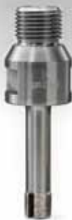
FORETTI PER FORI CIECHI NON CORING BITS