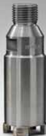
FORETTI A SETTORI SEGMENTED CORE BITS