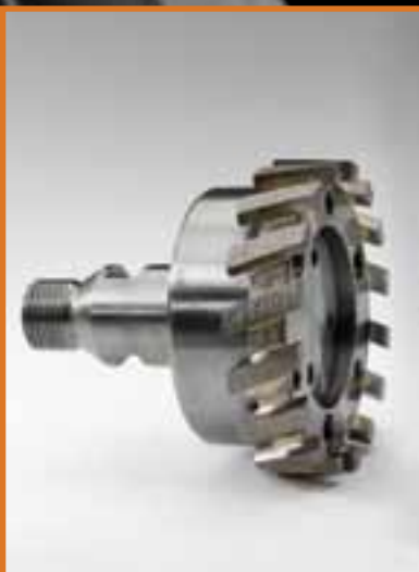
MOLE DA SCASSO STUBBING WHEELS