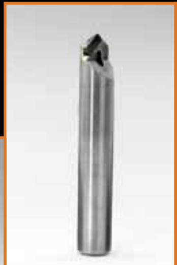
PUNTA IN PCD PCD ENGRAVING BITS CONIC MILL FOR WRITING