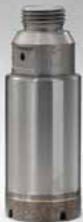
FORETTI PER MACCHINE CN CORE BITS CNC MACHINES