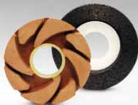
LUCIDANTI PIANO DRAINBOARD WHEELS FOR FLAT POLISH