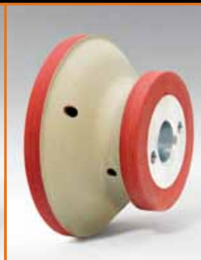
MOLE LUCIDANTI GOMMOSE RUBBER POLISHING