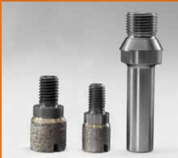
FRESE PER TAGLIO IN PASSATE FOR INCREMENTAL CUTTING