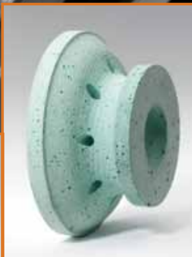
MOLE LUCIDANTI POLISHING WHEELS