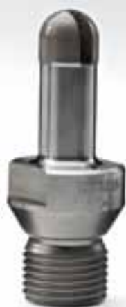
FRESE PER SGOCCIOLATOIO DRAIN GROOVE ROUTERS