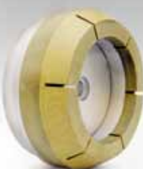
LUCIDANTI BORDINO RESIN CHAMFERING WHEELS