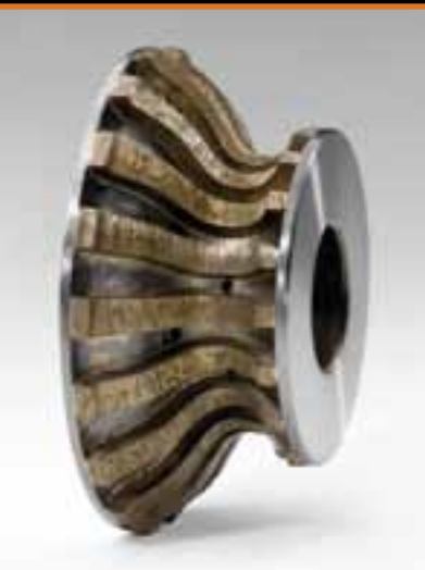
MOLA A SETTORI SEGMENTED DIAMOND WHEELS