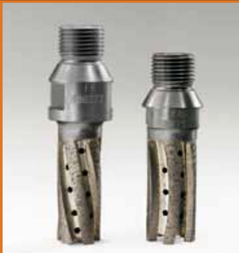
FRESE A SETTORI FINGER BITS