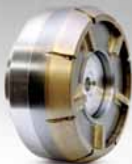
DIAMANTATE BORDINO E PIANO DRAINBOARD WHEELS