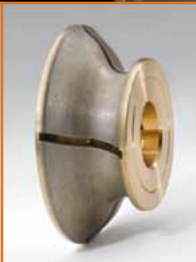
MOLE A FASCIA CONTINUA CONTINUOUS DIAMOND WHEELS